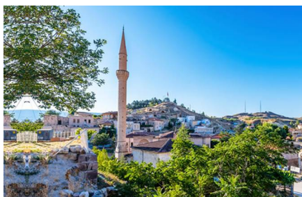
Mustafapaşa/Provincia di Nevşehir