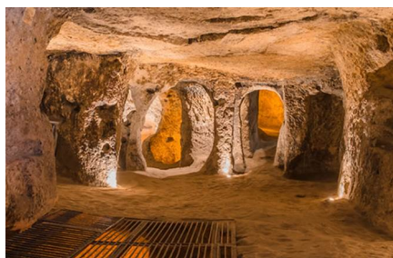
Derinkuyu/Provincia di Nevşehir