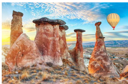
Göreme/Provincia di Nevşehir