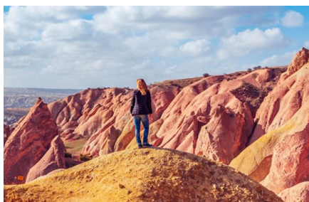
Avanos/Provincia di Nevşehir