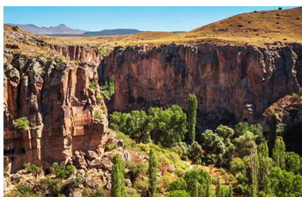
Ihlara/Provincia di Aksaray