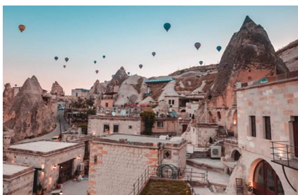
Nevşehir/Provincia di Nevşehir