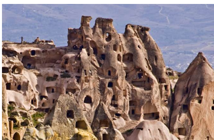
Uçhisar/Provincia di Nevşehir