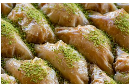
Kaymaklı/Provincia di Nevşehir