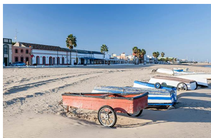
Sanlúcar de Barrameda