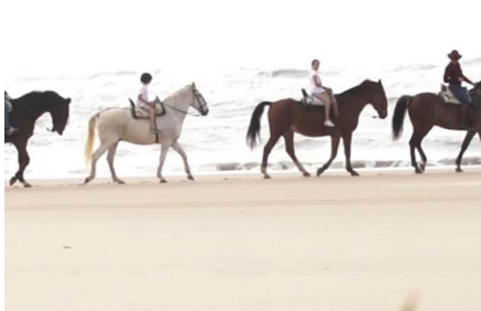
Parco nazionale di Doñana