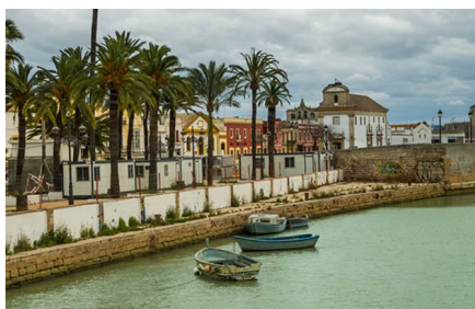
El Puerto de Santa María