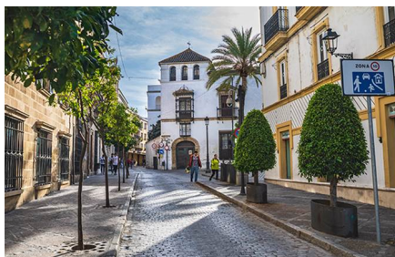
Jerez de la Frontera